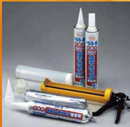
◀ 内装用床根太・床仕上げ接着剤 #55-S シリーズ